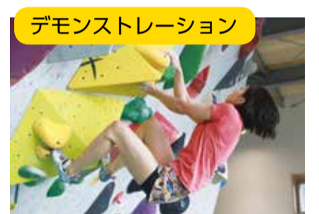
デモンストレーション

スポーツクライミングには、「リード」、「ボルダー」、「スピード」の3種目があり、今大会で行われた「ボルダー」は、ロープを付けずに高さ約5メートルの壁に設定された課題と呼ばれるルートを制限時間内にいくつ完登(最後まで登りきる)できたかを競う種目です。