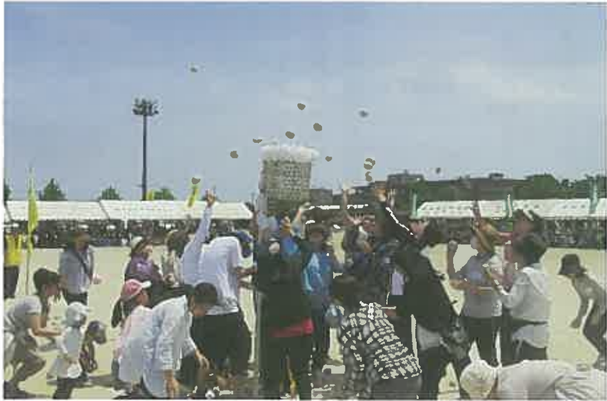
大根鶴巻地区体育祭の「楽しく玉入れ」競争

第61回秦野市民体育祭は、5月15日（日）に市内6地区で各地区体育協会の主催により開催されました。今年は晴天に恵まれ、競技に参加された皆さんは、心地よい汗を流し、笑顔あふれる和気あいあいとした雰囲気の中にあっても、真剣勝負により会場はとても盛り上がっていました。