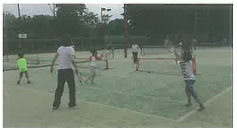
親子でテニスにチャレンジ