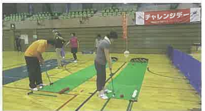
スカットボールにチャレンジ

平成29年5月31日(水) チャレンジデー2017 秦野市 初参加・初勝利! ありがとうございました!