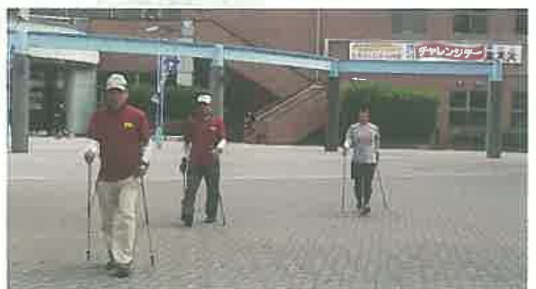
ノルディックウォーキングにチャレンジ

※紙面・印刷スケジュールの関係で一部のチャレンジデー速報写真を掲載させていただきました。市内では他にも様々な運動・スポーツの取組みが行われました。