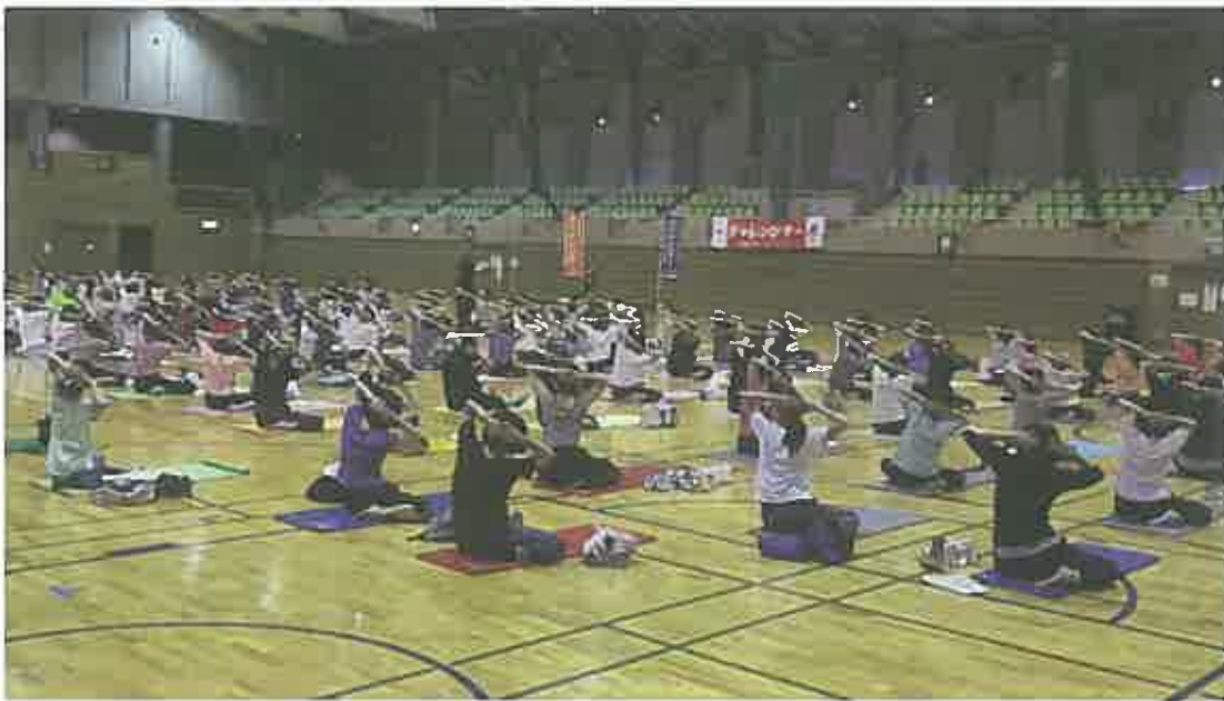
総合体育館メインアリーナでタイ式ヨガを体験