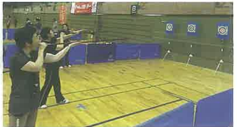
スポーツ吹矢にチャレンジ

10万人の参加を目指した、宇部市・宇部市スポーツコミッションさんの熱い取組みに触発され、初参加の私たちも頑張ることができました! チャレンジデーはノーサイド! 共に競い合った山口県宇部市にエールを送りましょう!