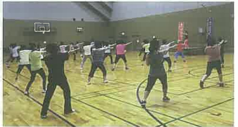
ボクシングエアロビクスにチャレンジ