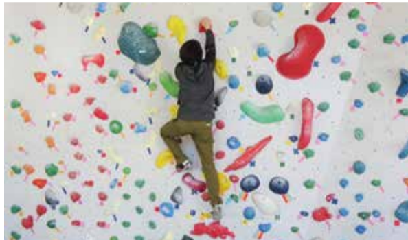
スポーツクライミング体験教室