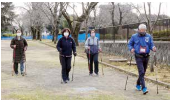
ポールウォーキング体験教室

はだの健幸スポーツ応援券配布事業は、秦野市におけるスポーツ実施率が低い、ビジネスパーソン、子育て世代の女性をターゲットにした社会実験です。そのため、スポーツ庁への事業提案のとおり、モニター参加者を、商工会議所会員事業所の従業員、JA組合員（准組合員）及びその家族で子育て世代の女性に限定し、募集を行いました。