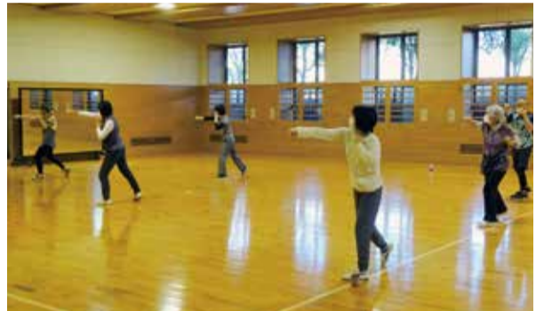
ボクシングエアロピクス教室