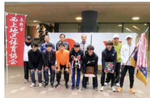
総合優勝 西上チーム

その他の記録は、秦野市役所ホームページ（www.city.hadano.kanagawa.jp）に掲載されています。