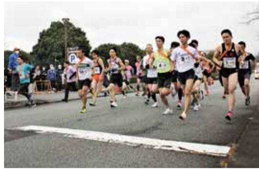
全26チームがスタート

前回大会優勝の南チームは、2区の牧選手と5区の指宿選手が区間賞の快走を見せたものの、連覇ならず、総合3位に終わりました。