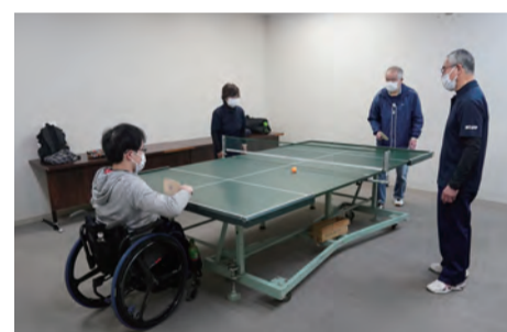
サウンドテーブルテニス