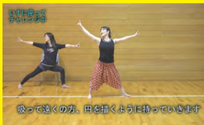
吸って遠くの方、円を描くように持っていきます