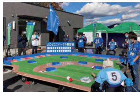
ユニバーサル野球