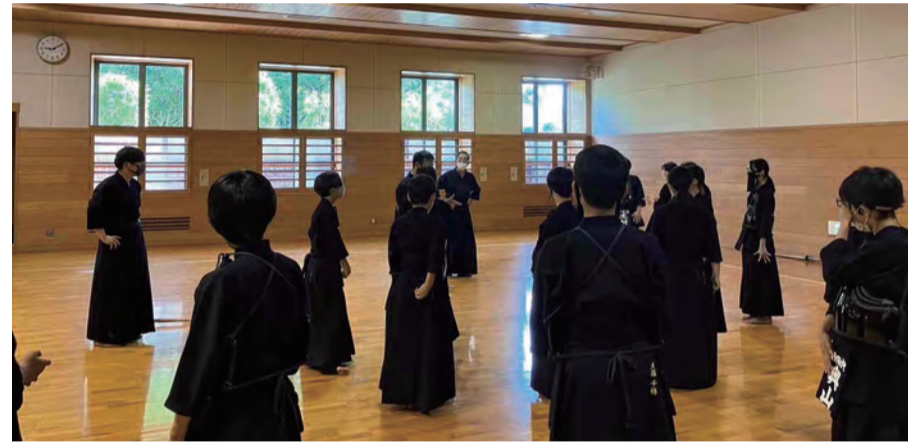
市内中学校の剣道部、地域部活動の様子 (メタックス体育館はだの(総合体育館))

特に市内中学校の剣道部の取組については、秦野市剣道連盟と中学校が協働することで合同練習会の枠組みを利用して「子どもたちの活動をする機会の確保を目指す環境整備の構築」に努めており、こうした取組については県内外からも視察を受けるなど、注目を受けています。