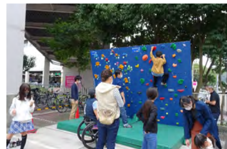
ボルダリング体験