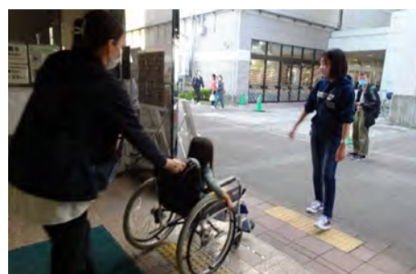
障害のある生活体験