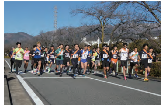
全31チームがスタート

その他の記録は、秦野市役所ホームページ(www.city.hadano.kanagawa.jp)に掲載されています。